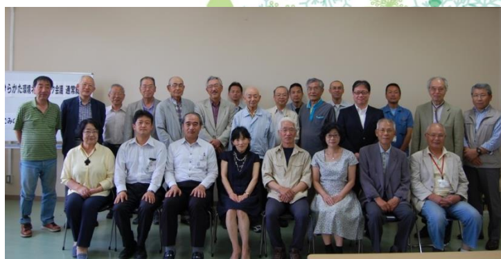
総会終了後、集合写真