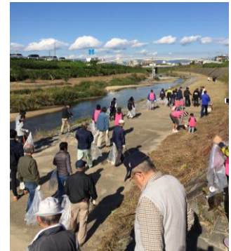
去年の参加の様子です。