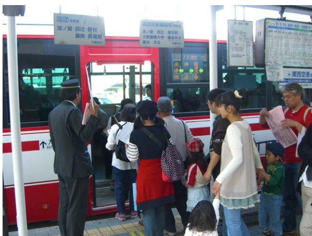
枚方市駅南口津田駅行きバス