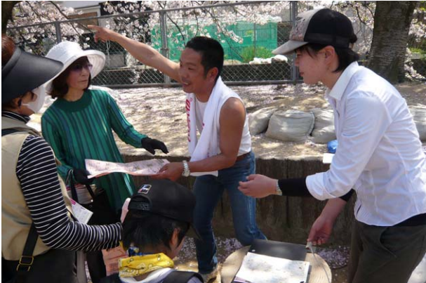
免除川(長法寺小学校ポイント)