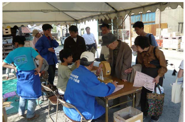
山野酒造ガラガラ抽選会場