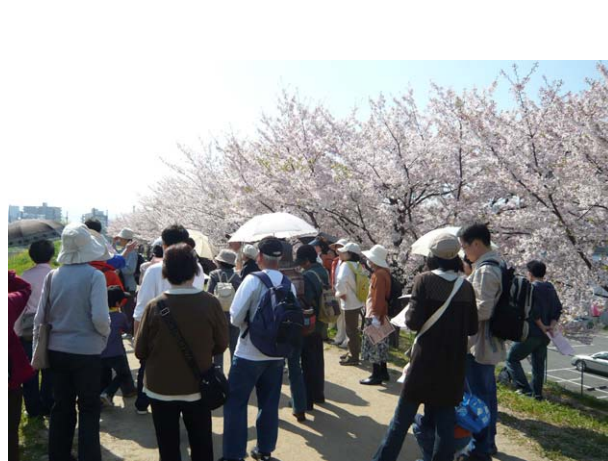
秘密ポイントは天野川