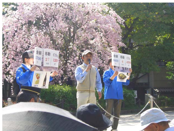
バスとまちのお話（大阪大学大学院松村暢彦准教授）