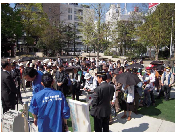
岡東中央公園（竹内脩市長挨拶）