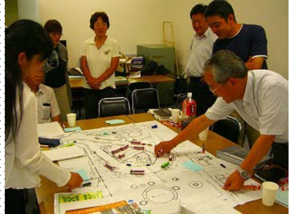
←駅前広場の地図を前に交通処理問題について話し合う参加者

また、樟葉駅前ロータリーや周辺道路の交通処理問題については、参加者間で2班に分かれ、大よその縮尺図面の上に、車両模型を配置しながら、現状の問題点等を出し合いました。