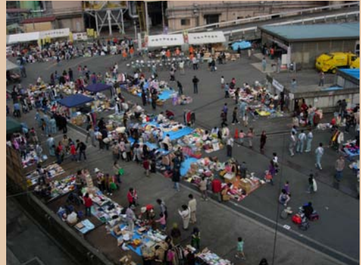
← 昨年のごみ減量フェア

ひらかた環境ネットワーク会議では、今年はじめてこのイベントに参加し、エコチェックDAYのPR活動や自転車発電など温暖化防止対策の啓発活動を行います。