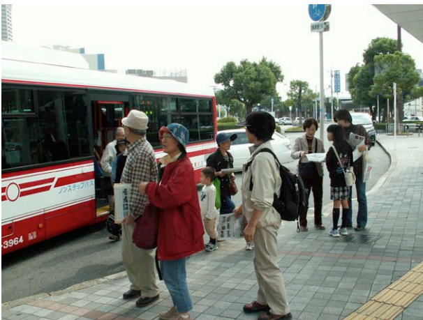
樟葉駅で次の行き先を考える