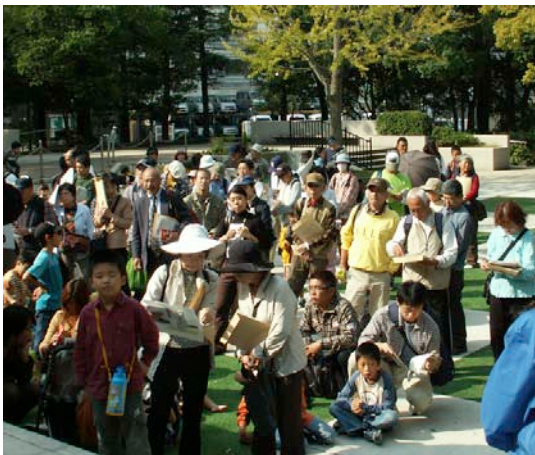
ゲームルールの説明を聞く