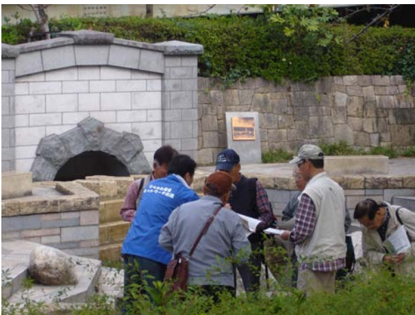
水面廻廊でボランティアガイドの説明を聞く