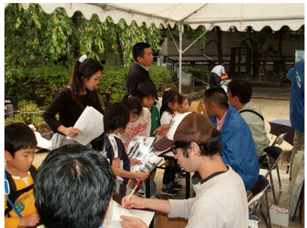
答え合わせのあとガラガラくじを引く