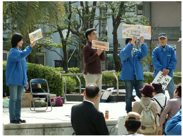
松村先生のバスとまちのお話