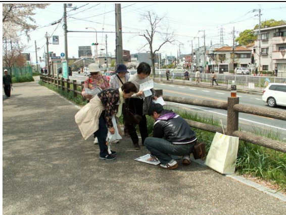
打上川治水緑地のスタンプポイント