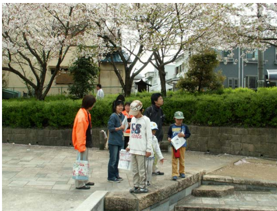
水面廻廊でボランティアガイドさんの説明を聞く