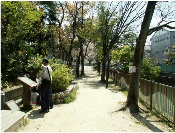
友呂岐緑地クイズポイント