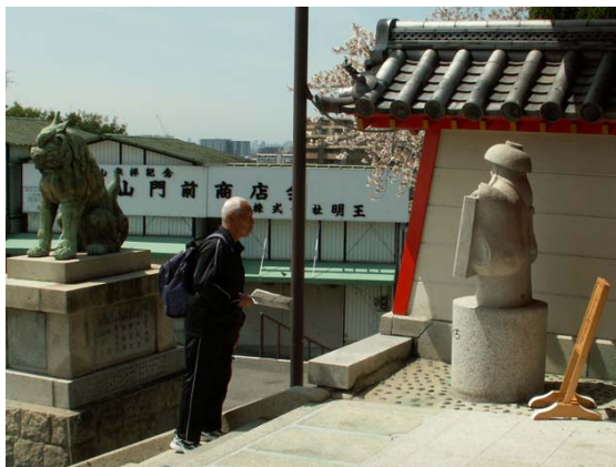
成田山不動尊前のはちかづきちゃんの碑を見る