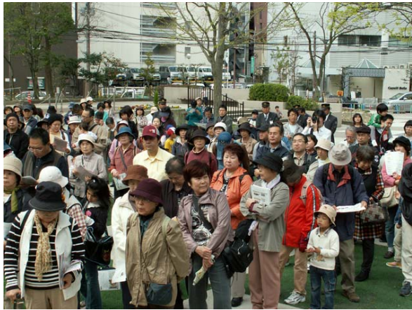
説明を聞く参加者達