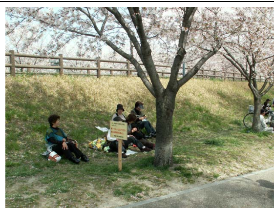
打上川治水緑地で昼食をとる