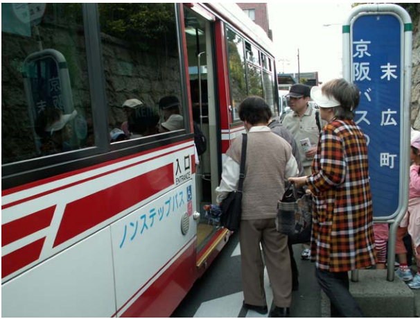
末広町で枚方市駅行きのバスに乗り換える