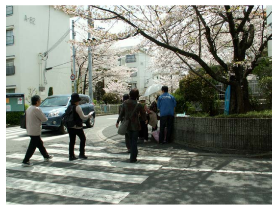
三井団地のスタンプポイント