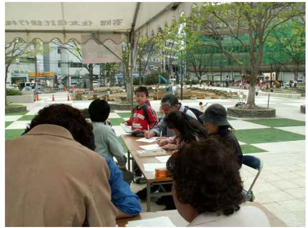
アンケートに答える