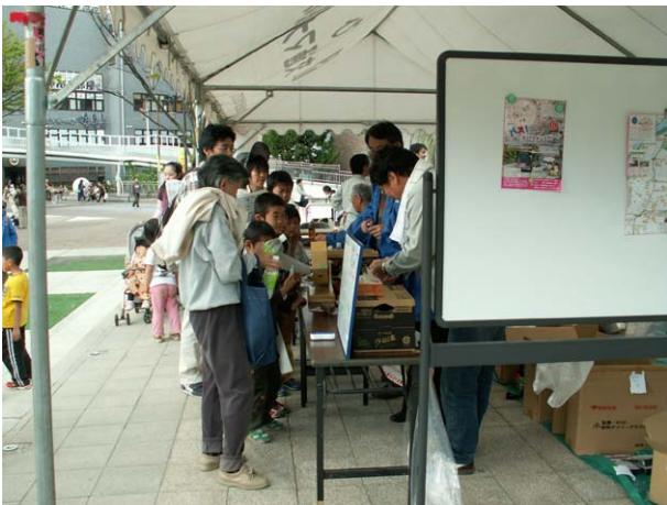
ガラガラくじの抽選