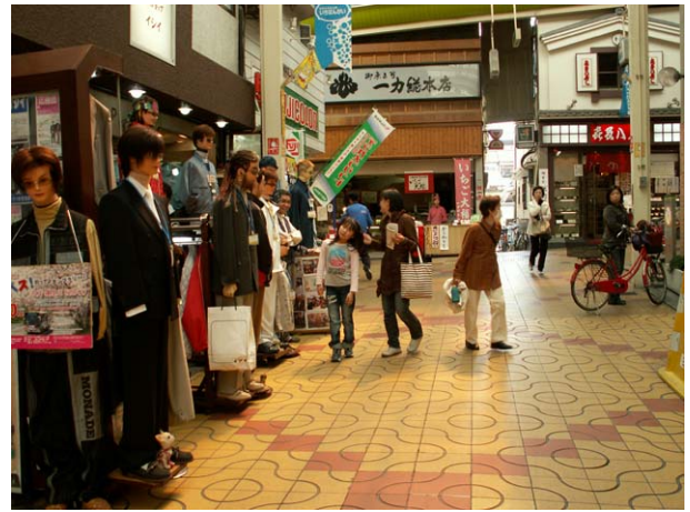
「イシイ」スタンプポイント