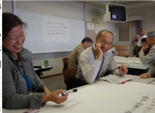
グループで話し合いの様子

また、最終日には新規サポーター、旧サポーター、そして環境教育サポート部会メンバーを含めた総勢25名が集まり、懇親会を開催。日ごろの環境活動について意見交換し、それぞれが自己紹介や現在の自分の活動なども報告しました。