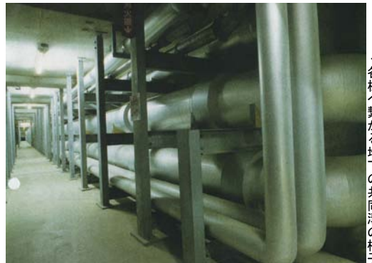
← 各棟へ繋がる地下の共同溝の様子