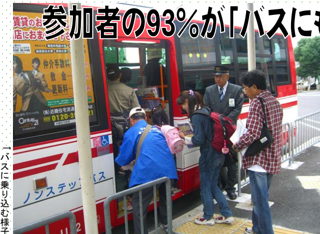
バスに乗り込む様子

環境にやさしい公共交通の利用促進を目的に、路線バスで市内各所をめぐる「バスのってスタンプラリー」を10月23日(土)に行いました。今回は10回目という節目でもあり、市内各所を探検し、普段気付かなかった事を改めて再発見してもらおうと「ひらかた探検隊」のテーマで開催し、環境の取り組みに活躍している企業、「コマツ大阪工場」「関西リサイクルシステムズ」にも今回初めて協力して頂きました。136名の参加者は、受付で渡されたバスの路線図やクイズが書かれたスタンプ用紙等々を手にとり、スタンプポイントを巡りました。今回の最終ゴールは、「ひらかたパーク」ゲート前に設定し、スタンプの数とクイズ正解数と合わせた点数に応じてくじを引き、景品をゲット！さらに交通アンケートにお答え頂いた