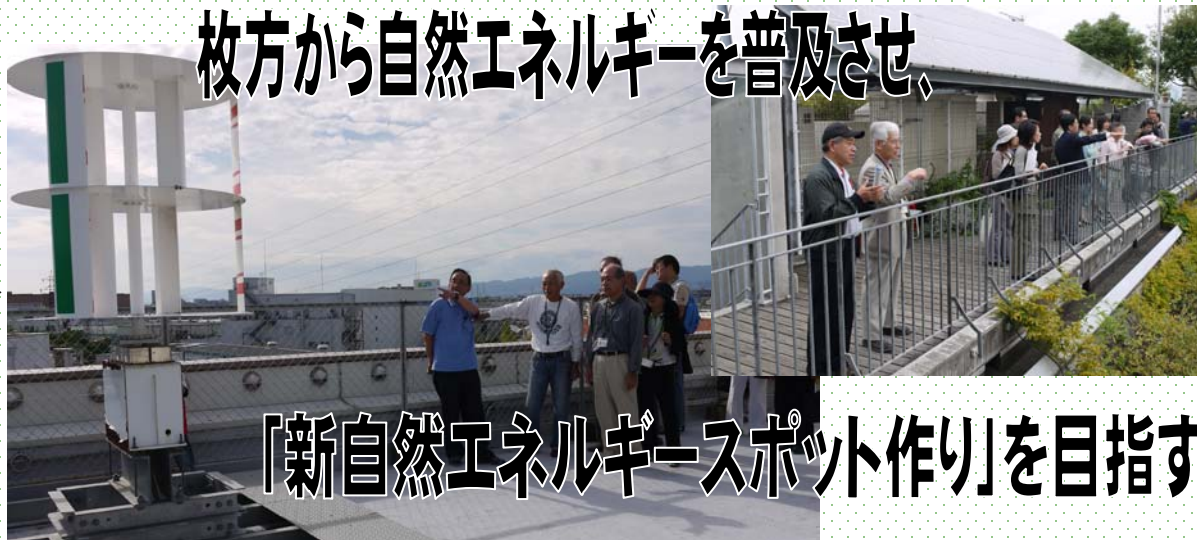
→ 第1回枚方市内見学会の様子