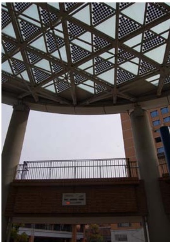
→ 賞を受賞した学生が集う太陽光発電のホール

これだけの省エネの最新施設を持つと、今以上の CO 2 を削減するのは非常に難しく、簡単ではありません。大学で掲げる「年間 CO 2 1% 削減目標」をクリアするには大変な努力が必要です。目標達成に向けた取り組みとして、毎年職員向けに省エネ発表会を行うことで、意識啓発を図っています。そのことで、職員の意識は高くなっています。このように多くの学生にも環境への関心が高まる事を期待します。