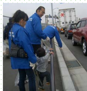
「天の川大清掃の様子」

ひらかた環境ネットワーク会議は川沿いの車道を担当しましたが、タバコの吸い殻や空き缶など車窓から捨てたと思われるごみが多く、マナーの悪さを実感しました。また、今年は大学生や高校生の心強い若いメンバーも参加されており、活気溢れる大清掃となりました。