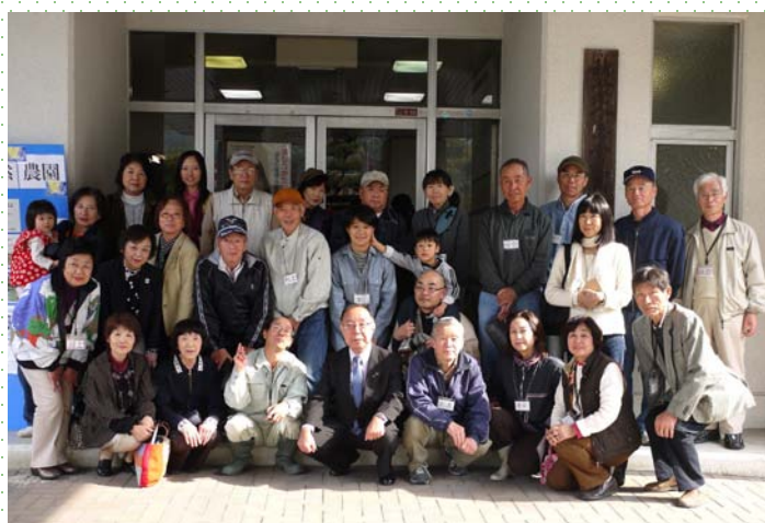
→ 第3回穂谷自然農園市長を囲んでの集合写真

今年で4回目となる「ひらかた自然エネルギー学校」を9月26日より開講し、3回にわたり31名の受講生の参加がありました。今までと違い、前半は講座形式、後半は移動して直接現場を見学するというスケジュールにし、前半の内容がより分かりやすいように工夫しました。また、セミナーの内容を自然農園も楽しめる企画を入れたりして工夫したことや、広報に力を入れたこともあって、家族連れや箕面からなど遠方からの参加者もあり、受講生もスタッフも今までで一番手ごたえのある活気溢れたセミナーとなりました。