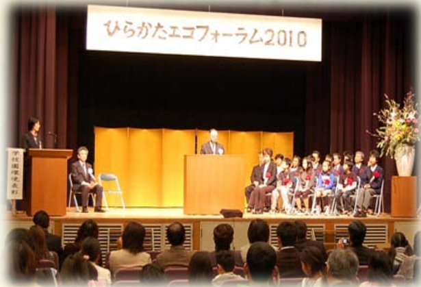
「昨年」の受賞式の様子

午前の部は例年同様、環境表彰が行なわれます。環境の各分野で頑張っている学校や園、市民・市民団体、そして事業者の表彰が行われます。午後からは、エコチェック DAY の中間結果報告に始まり、たい肥作り講習会やクラフト教室、環境紙芝居に環境クイズ等盛り沢山の企画を用意しています。