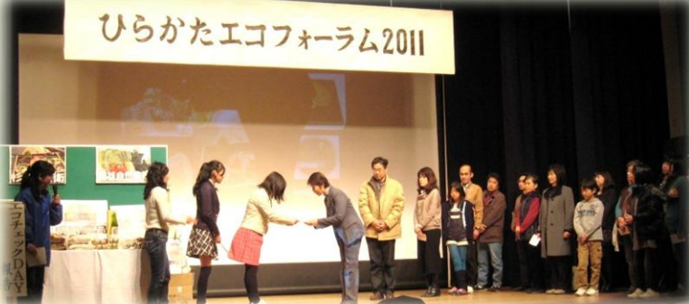
エコチェック DAY の回収枚数が昨年度比 60%増となる結果に歓声が上がりました(写真はエコチェックDAY当選者への賞品渡しの様子)