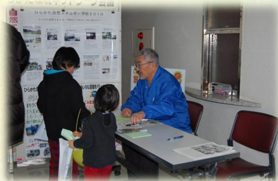
13団体すべてのブースを回ってクイズに答えると試食券がGETできるゲームを行いました