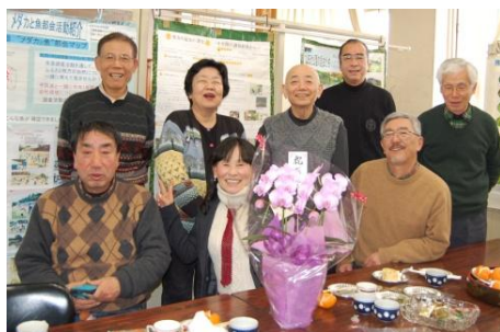
一7周年記念の様子