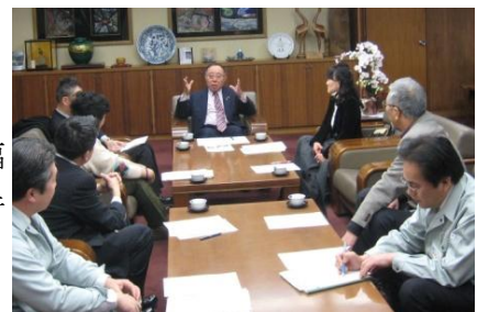
一市長表敬訪問の様子

2月28日(金)にエコチェックDAYの中間報告を行う為、市長を表敬訪問しました。報告後、予定していた時間を大幅に過ぎ一時間近くに渡って様々な事柄について意見交換を行いました。