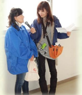
FMひらかたやKキャットで当日の様子が流れました