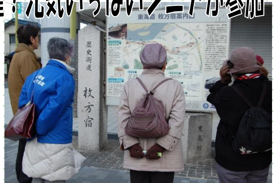
→ウォーキングの様子

3月5日(金)「東海道宿場町再発見ウォークと歴史講演」を開催しました。48名の参加者と共に午前は枚方宿東見付跡から西見付跡まで観光ガイドと共に歩きました。わずか1.5kmの間に濃縮された、いくつもの史跡に、今までとは違った見方で歩く事ができ「何気なく通っていた道や建物にこんなにも歴史的価値があったなんて」と参加者は感激した様子でウォーキングを楽しみました。