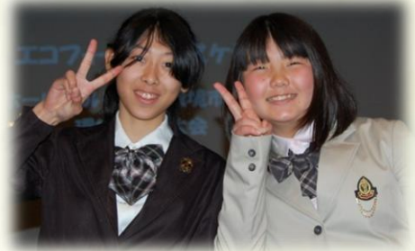
当選者に賞品渡しを手伝ってくれた左より葵ちゃん、咲ちゃん