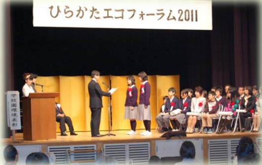
環境表彰では様々な環境分野での取り組みで頑張っている学校園・団体・個人が表彰されました