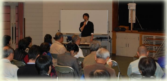
団体・事業者・行政が取り組んでいる活動を発表し、市民と意見交換を行った“わいわい！環境市民トーク”。 「もっといっぱい聞きたかった」と参加者の声。