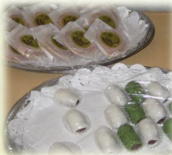
枚方の名産品試食は子供たちに大好評！