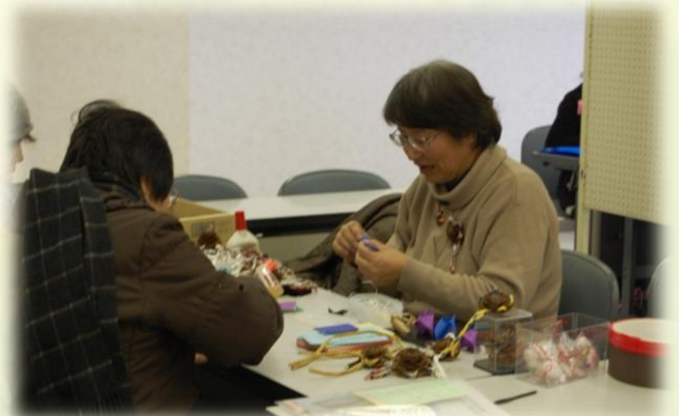
自然クラフト教室では家族連れや女性に人気！自分の作った作品を喜んでもって帰っていました