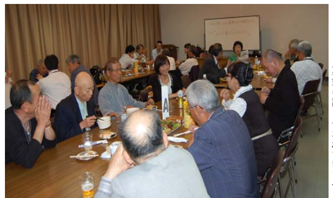
←真剣に話し合われています

グループに分かれて持続可能な社会の為に、改めて私たちのライフスタイルや、エネルギー問題等について、真剣に話し合わせ、活発な意見交流会となりました。