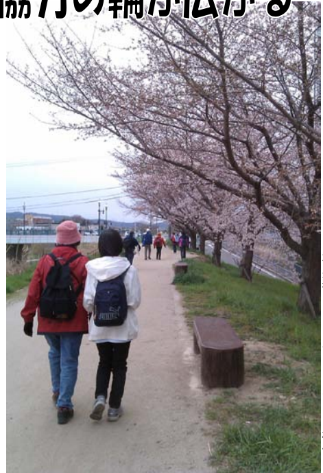
河川敷をウォーキングしている様子

月に1回集まり、みんなとわいわい話しながら一緒に活動して下さる方を募集しています！「こんな町にしたい」という熱い気持ちがあれば大丈夫！興味のある方はぜひ事務局までご連絡下さい。