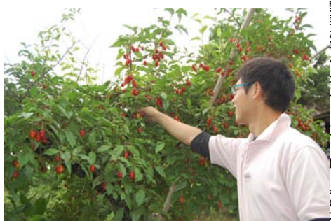
一年中楽しめるよう四季折々の果物や野菜が味わえます。こちららはぐみの木

今回は枚方市杉責谷にある農園 杉・五兵衛におじゃましてお話を伺ってきました。ここは自然あふれる農園レストランです。ロバを飼い、その糞を発酵させたものをたい肥として農薬や化学肥料を使わず野菜や果物を育て、収穫したものを料理として提供する「有機循環農法の輪」を推進し、生態系を崩すことなく自然と共に共存しながら運営しておられます。昔当たり前だったのどかな里山の風景がここにはあります。